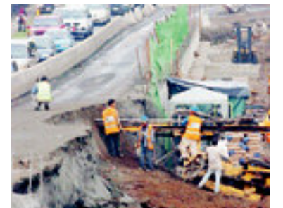
Hubo presas porque dos carriles quedaron inhabilitados. MARIO ROJAS

Arreglo de muro de contención tardará entre 7 y 10 días