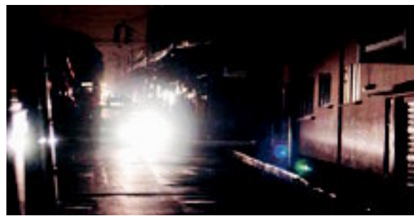
Heredia centro quedó a oscuras.