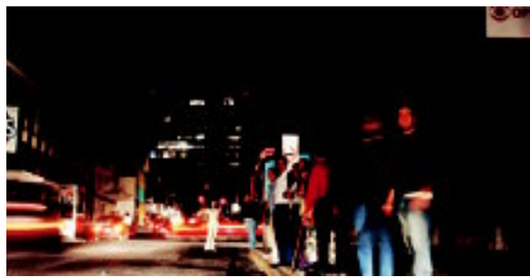
Pasajeros de taxis en calle 11, San José. ADRIANA OVARES

ICE alega un daño en la línea de transmisión Arenal-Cañas; servicio fue restableciéndose de manera paulatina