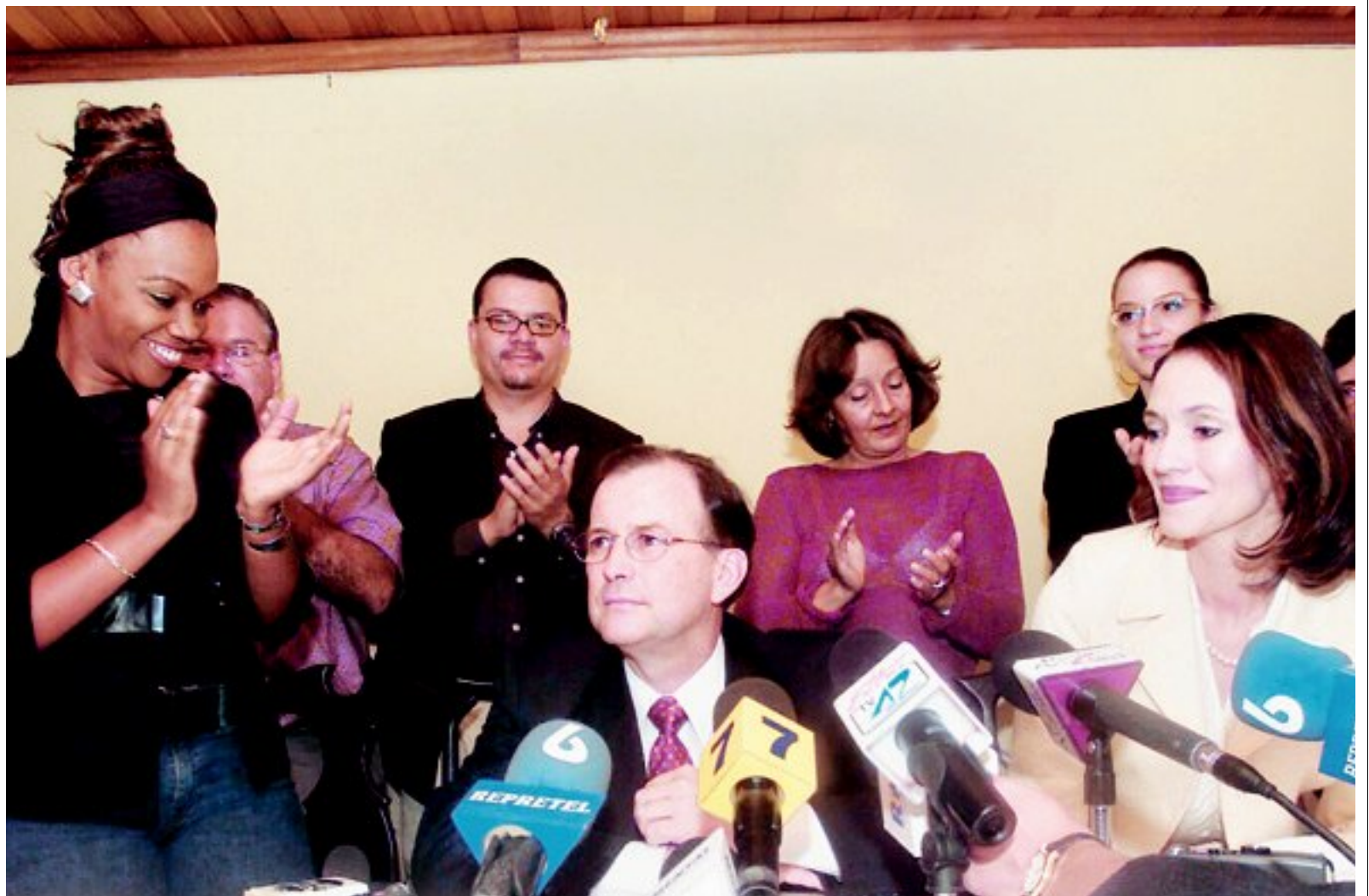
Anuncio INSTANCIA AL DIÁLOGO

"Es tiempo para construir desde las coincidencias, pero a ellas se puede llegar sólo si respetamos las diferencias"