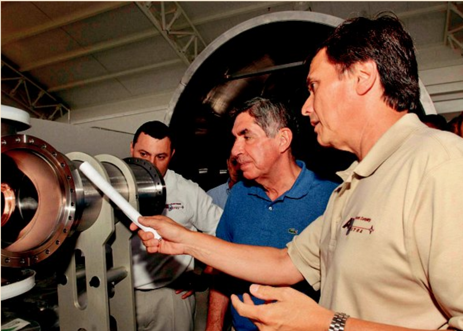
El astronauta y físico Franklin Chang (derecha) mostró ayer al presidente Óscar Arias uno de los componentes de su motor: una antena que transmite ondas de radio a un gas con el fin de transformarlo en plasma. El aparato es parte de su laboratorio de tecnología espacial. P. 16