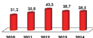
Eje 4: Gestión de Servicios Económicos Calificación comparativa por año