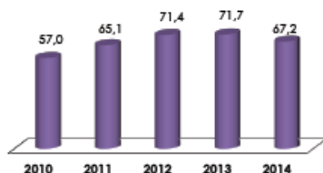
Eje 1: Desarrollo y Gestión Institucional Calificación comparativa por año