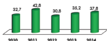
Eje 3: Gestión de Desarrollo Ambiental Calificación comparativa por año