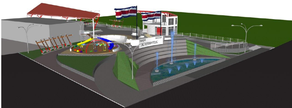
Propuesta por la Municipalidad de Nicoya, Presentada en el primer concurso de bonos comunales del MIVHA 2015. Arq. Jonathan Soto.