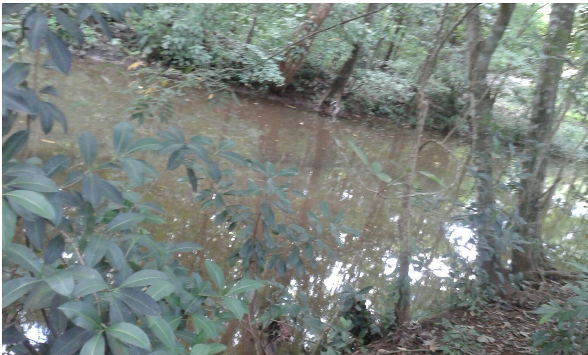
Fotografía Rio Potrero, principal fuente superficial de distribución de agua potable en la ciudad de Nicoya y Hojancha.

La conservación es un estado de armonía entre hombre y tierra.-Aldo Leopold